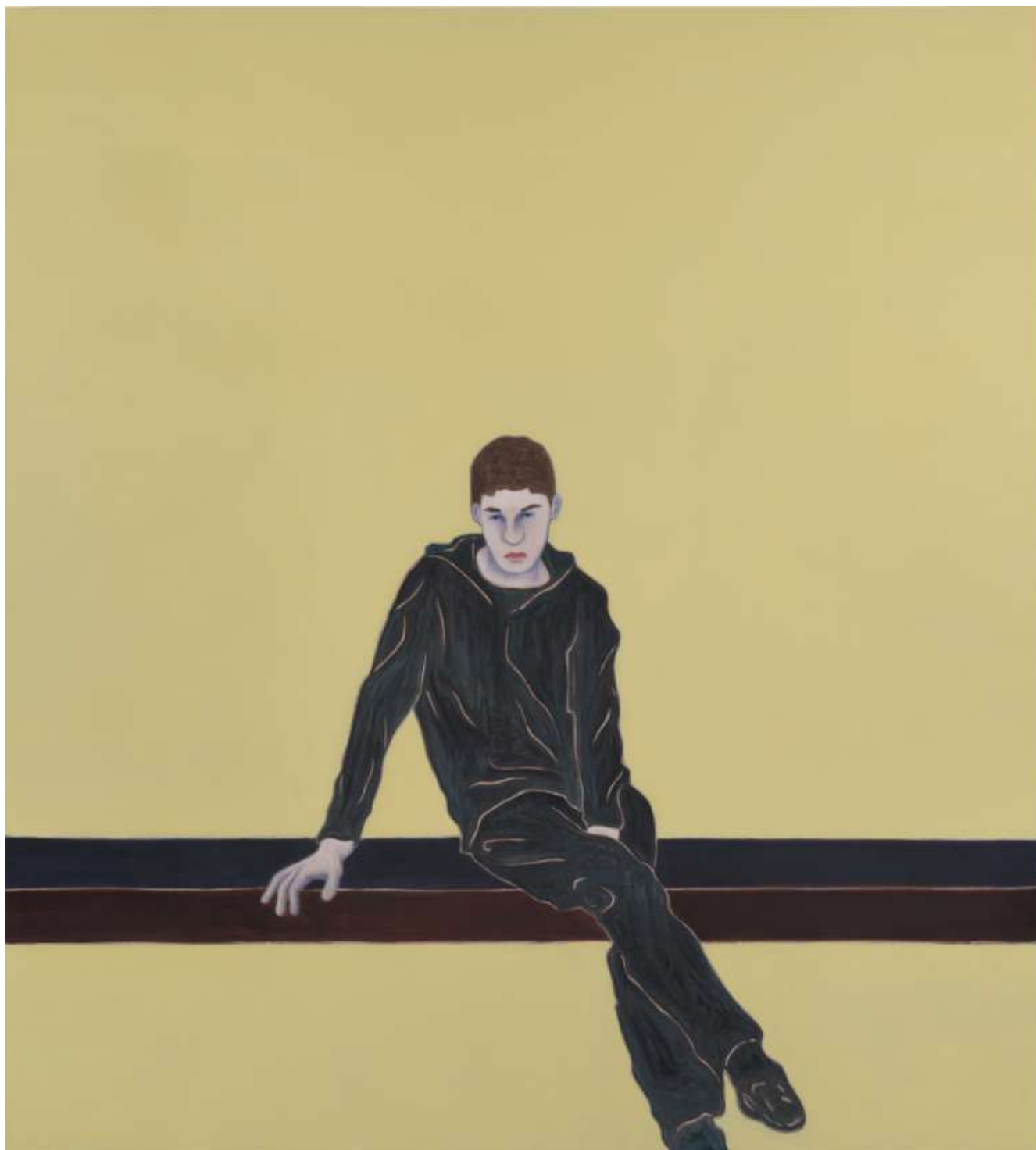
Djamel TATAH, Sans titre , 2016, huile et cire sur toile, 220 × 200 cm, Paris, galerie Poggi. © Jean-Louis Losi / © Adagp, Paris, 2022

Certaines œuvres de Djamel Tatah donnent à voir des figures qui fonctionnent comme des archétypes : « Je cherche l'expression abstraite d'une représentation de l'homme, avec une volonté de dépouillement », souligne l'artiste. Ce dernier confère une présence trouble et évanescence à ses figures, dont la blancheur charnelle induit un aspect quelque peu spectral, rappelant un processus de stylisation à l'œuvre dans les enluminures persanes, indiennes ou arabes, mais également dans la peinture d'icônes issue de l'art byzantin. Interpellant de manière frontale le regardeur, les visages peints par Djamel Tatah, dans bien des cas, nous confrontent, nous forcent au silence, de par leur puissante et parfois insoutenable présence.