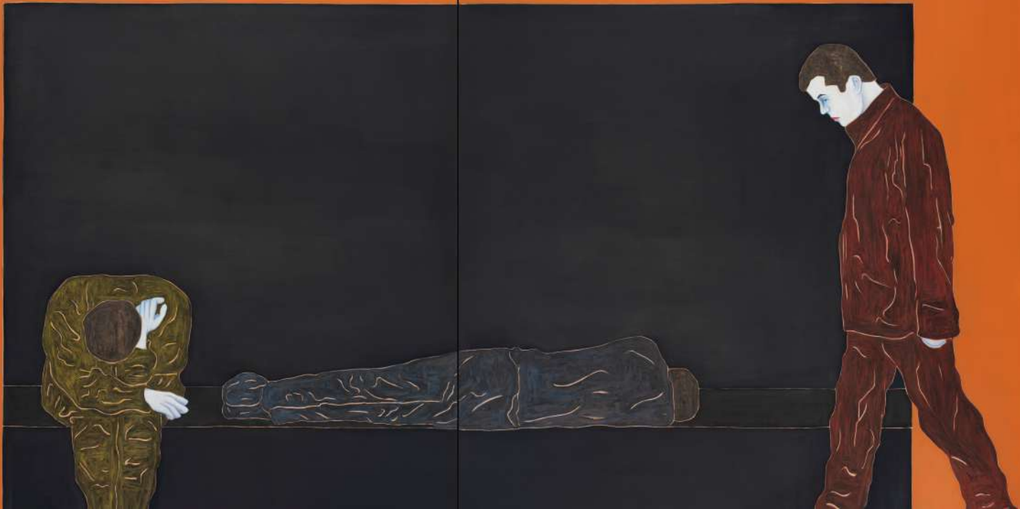
Djamel TATAH, Sans titre , 2021, huile et cire sur toile, diptyque, 220 x 400 cm, collection de l'artiste.

© Franck Couvreur / © Adagp, Paris, 2022