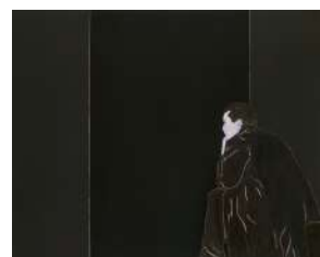
Djamel TATAH, Sans titre , 2011, huile et cire sur toile, 200 x 250 cm, collection privée, France. © Jean-Louis Losi / © Adagp, Paris, 2022