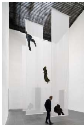
Djamel TATAH, Sans titre , 2019, lés gravés et peints recto verso sur toile varia ignifugée M1, ensemble de 4 lés de 740 x 150 cm chacun, collection de l'artiste. © Musée Fabre de Montpellier Méditerranée Métropole - photographie Frédéric Jaulmes / © Adagp, Paris, 2022