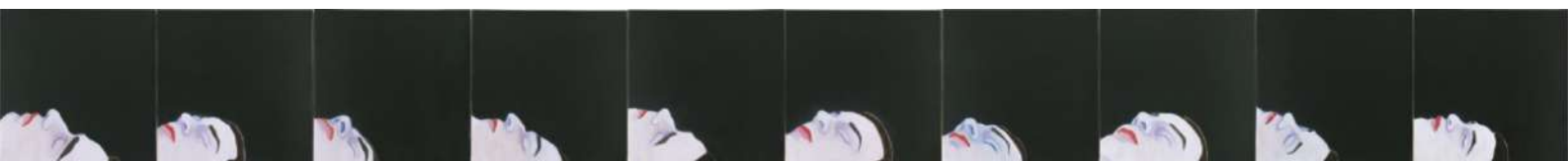
Djamel TATAH, Sans titre , 2010, huile et cire sur toile, polyptyque, 40 x 400 cm, Art Concept. © Jean-Louis Losi / © Adagp, Paris, 2022

Cette succession longiligne d'une même tête, dix fois fragmentée et répétée, est évocatrice des tentatives de décomposition du mouvement menées au XIXe siècle par le photographe britannique Eadweard Muybridge, initiateur de la chronophotographie. Plusieurs toiles ont été réalisées par Tatah suivant ce principe. Pourtant, l'action photographiée se résume ici à un homme aux yeux clos, immobile, bien loin d'une décomposition d'un mouvement rapide et frénétique qui passionnait les photographes en leur temps. Dans cette image d'abord captée par la photographie, c'est davantage l'objectif qui semble se déplacer autour du modèle, saisissant les contours, les reliefs, les nuances d'un visage dont l'universalité de la situation – l'endormissement ou la mort – ne peut qu'exercer une fascination sur le regardeur.