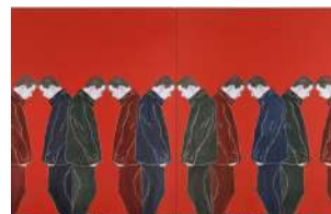
Djamel TATAH, Sans titre , 2016, huile et cire sur toile, diptyque, 250 x 400 cm, collection de l'artiste. © Jean-Louis Losi / © Adagp, Paris, 2022