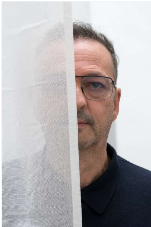
Djamel Tatah, 2022.

Djamel Tatah expose la première version de l'œuvre Les Femmes d'Alger dans l'exposition « Picasso & Les Femmes d'Alger », au Museum Berggruen à Berlin.