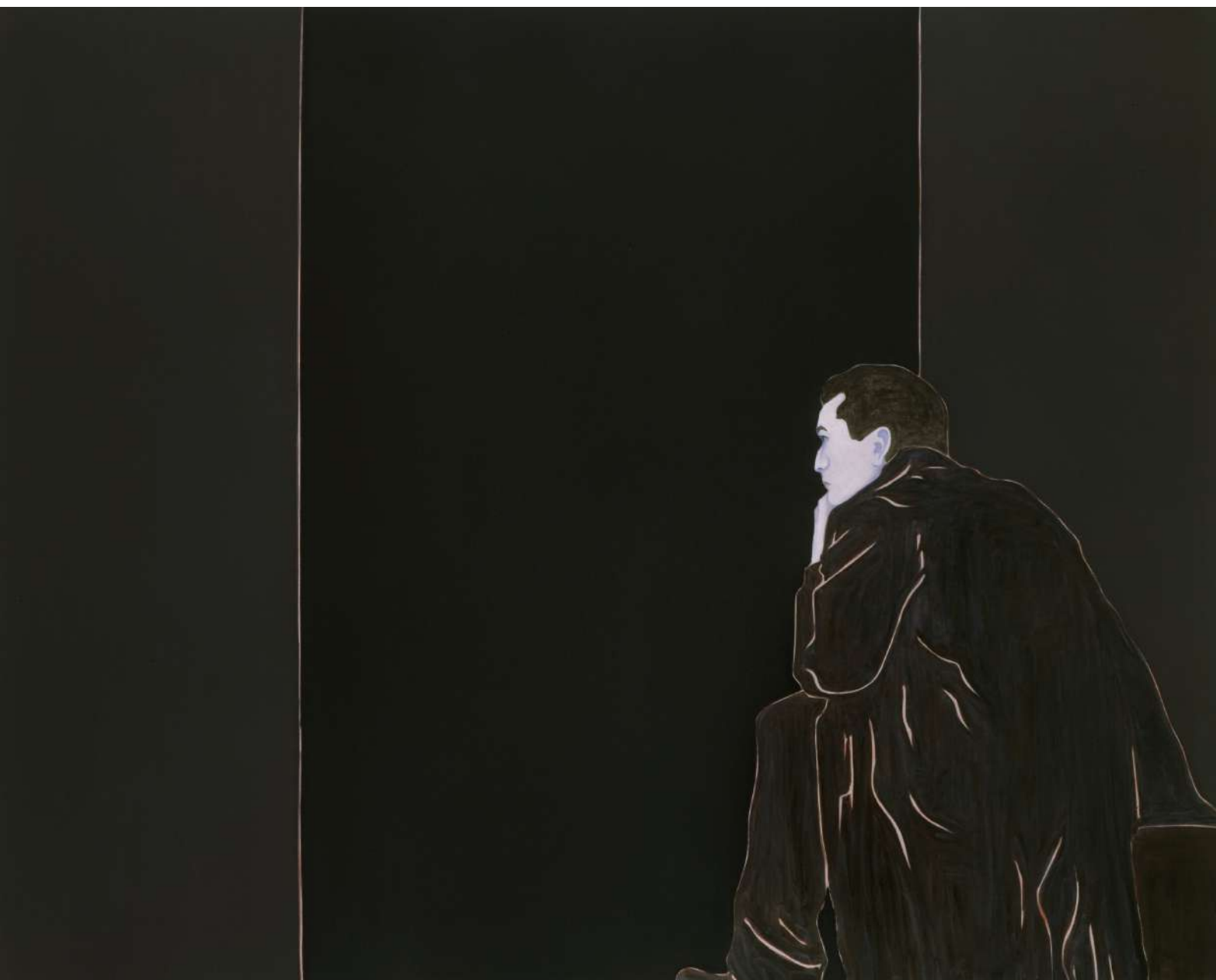
Djamel TATAH, Sans titre , 2011, huile et cire sur toile, 200 x 250 cm, collection privée, France.

Évocation de la figure du Penseur d'Auguste Rodin, cette œuvre, traitée dans des nuances particulièrement sombres, intègre un personnage absorbé dans une activité méditative, qui ignore le spectateur, comme c'est le cas de nombreuses toiles de l'artiste. Cette démarche picturale, longuement étudiée par le critique Michael Fried et conceptualisée sous le terme d' absorbement , entraîne selon ce dernier, par mimétisme, le même phénomène chez le regardeur, happé par le tableau. Cette peinture de l' absorbement se rapproche notamment de certaines scènes de genre de la peinture française de la seconde moitié du XVIIIe siècle, bien qu'ici l'action ne soit rien d'autre qu'un regard tourné vers le vide, vers une absence de perspective matérialisée par de grands aplats noirs d'où n'émerge que la pâleur du visage.