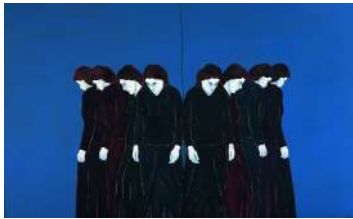
Djamel TATAH, Sans titre , 2004, huile et cire sur toile, diptyque, 250 x 400 cm, collection de l'artiste.