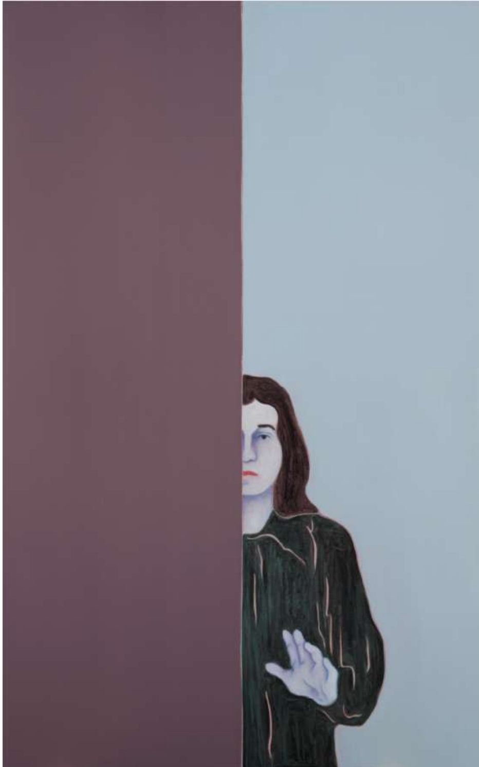
Djamel TATAH, Sans titre , 2018, huile et cire sur toile, 160 x 100 cm, collection de l'artiste. © Franck Couvreur / © Adagp, Paris, 2022

La frontalité à l'œuvre dans certaines toiles de Djamel Tatah sollicite un dialogue immédiat avec le regardeur, de l'ordre de la pure présence. Ce rapport direct au spectateur opère comme un marqueur de distanciation vis-à-vis de l'illusion théâtrale, usant d'un procédé d'adresse courant dans le théâtre contemporain qui induit l'existence d'un public, brisant ainsi le quatrième mur. Les aplats, qui tendent parfois vers le monochrome, semblent jouer le même rôle que les fonds d'or des icônes byzantines, qui évitaient l'évocation de tout contexte spécifique et préservaient le rapport frontal du spectateur à l'objet de dévotion. À ce titre, la figure de ce tableau, inspirée de La Vierge de l'Annonciation d'Antonello de Messine, semble nous poser la question de l'incarnation, non pas divine mais picturale, alors que, paradoxalement, les corps peints par l'artiste possèdent un aspect foncièrement désincarné.