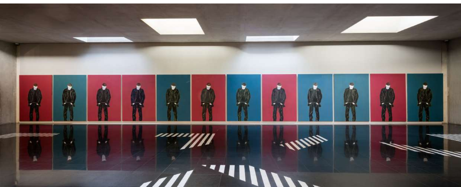
Djamel TATAH, Sans titre , 2005, huile et cire sur toile, ensemble de 12 tableaux de 220 x 160 cm chacun, collection de l'artiste.

Présentée dans les salles d'expositions temporaires du Musée Fabre, l'exposition se poursuivra également dans l'atrium Richier en introduction du parcours des collections permanentes, avec l'installation d'oeuvres gravées réalisées par l'artiste en collaboration avec l'atelier Michael Woolworth.