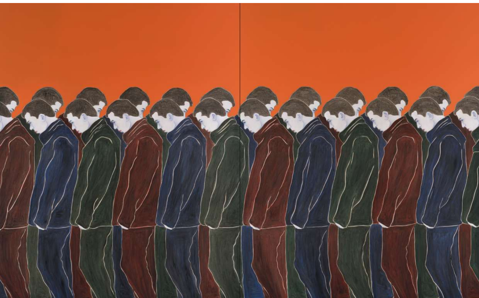
Djamel TATAH, Sans titre , 2016, huile et cire sur toile, diptyque, 250 × 400 cm, collection de l'artiste Photo © Jean-Louis Losi / © Adagp, Paris, 2022

Le principe répétitif est introduit par Djamel Tatah quelques années avant Les Femmes d'Alger , tableau qui exacerbe ce procédé. La répétition se fait alors de plus en plus présente dans son œuvre, prenant la forme de polyptyques ou de panneaux isolés donnant lieu à des survivances, parfois à plusieurs années d'écart, créant une généalogie d'une toile à l'autre. Inhérente à son travail, la reprise formelle et thématique « accentue l'idée » comme l'indique l'artiste lui-même : « Pourquoi ce personnage est-il répété plusieurs fois ? C'est pour accentuer l'idée. Comme dans la musique répétitive, cela devient progressivement lancinant. Mais c'est une fausse répétition. Tout se passe dans les nuances ». Dans certains ensembles, les formes humaines vont jusqu'à prendre l'aspect d'un motif, maintes fois reproduit, quasi ornemental, et ont par leur enchevêtrement, l'apparence d'une frise. Tout en déréalisant les figures, la répétition affirme la présence des corps tandis que les infimes nuances mettent à mal leur mimétisme : ce sont ainsi et avant tout des foules solitaires qui peuplent les toiles de Djamel Tatah.