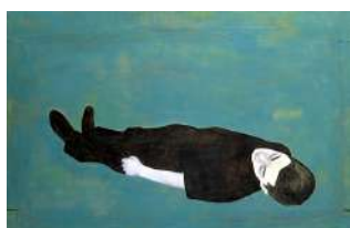
Djamel TATAH, Sans titre , 1992, huile et cire sur toile et bois, 128 x 199 cm Paris, Collection Frac Île-de-France, inv. 93.302.