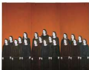
Djamel TATAH, Les Femmes d'Alger , 1996, huile et cire sur toile et bois, triptyque, 350 x 450 cm, Toulouse, Collection les Abattoirs, Musée - Frac Occitanie Toulouse, donation de la Caisse des dépôts et consignations, inv. 2004.3.3.