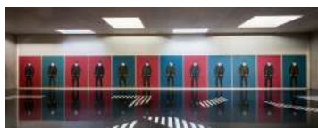
Djamel TATAH, Sans titre , 2005, huile et cire sur toile, ensemble de 12 tableaux de 220 x 160 cm chacun, collection de l'artiste. © Musée Fabre de Montpellier Méditerranée Métropole - photographie Frédéric Jaulmes / © Adagp, Paris, 2022