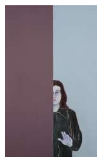
Djamel TATAH, Sans titre , 2018, huile et cire sur toile, 160 x 100 cm, collection de l'artiste. © Franck Couvreur / © Adagp, Paris, 2022