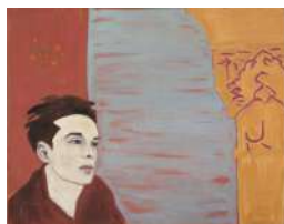
Djamel TATAH, Sans titre (Autoportrait à la Mansoura) , 1986, huile sur toile, 73 x 92 cm, collection de l'artiste.