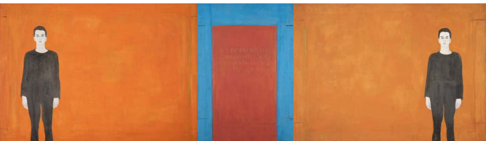
Djamel TATAH, Autoportrait à la stèle, 1990, huile et cire sur toile et bois, triptyque, 200 x 701.5 cm, Montbéliard, Collection musées de Montbéliard, inv. 1991.2.10.

Seconde version d'un tableau réalisé au retour de son voyage en Algérie, en 1982, ce double autoportrait fut présenté lors de la première exposition personnelle de l'artiste dans un musée, au château des Ducs de Wurtemberg à Montbéliard. La stèle, dont il est question dans le titre, se réduit à une forme abstraite, un rectangle rouge au centre du polyptyque, qui pourrait tout aussi bien être un seuil, une entrée dans le tableau. Elle se réfère par ailleurs au monument érigé à Tipaza en l'honneur d'Albert Camus, auteur dont la pensée humaniste a fortement influencé Tatah. La phrase qui y est gravée, extraite de « Noces à Tipasa », texte autobiographique de l'écrivain, marquera profondément l'artiste : « Je comprends ici ce qu'on appelle gloire : le droit d'aimer sans mesure ».