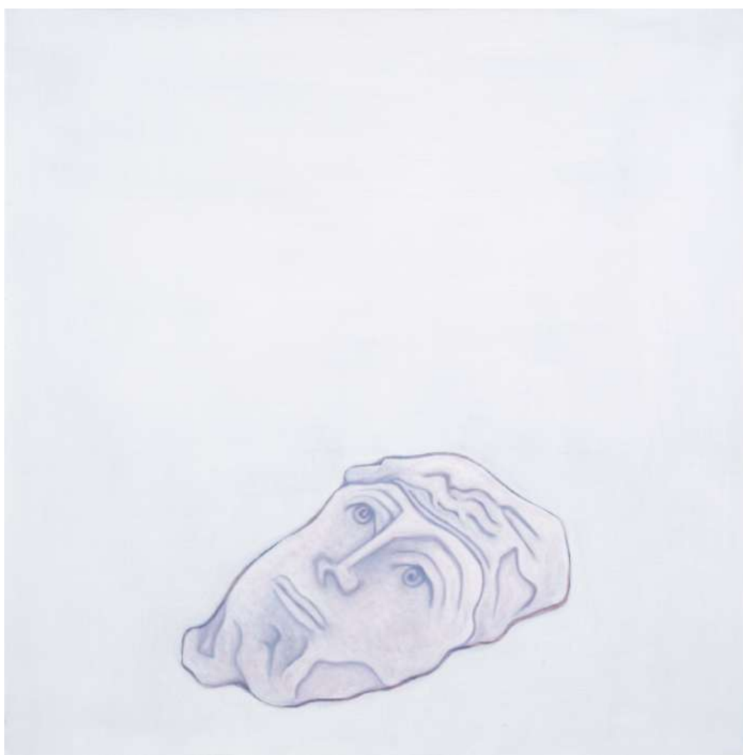
Djamel TATAH, Sans titre , 2016, huile et cire sur toile, 70 x 70 cm, collection de l'artiste. © Jean-Louis Losi / © Adagp, Paris, 2022

Œuvre rare – sinon unique – où la figure humaine n'existe qu'à l'état de ruine, cette toile de petite dimension pose la question de la suspension d'un point de vue non seulement physique mais également temporel. Le fragment de sculpture antique, dont le traitement coloré se rapproche du fond de la toile, signant, d'une certaine manière, sa disparition inéluctable, apparaît comme le seul vestige de toute transmission mémorielle.