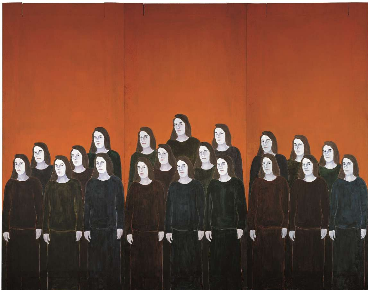
Djamel TATAH, Les Femmes d'Alger , 1996, huile et cire sur toile et bois, triptyque, 350 x 450 cm, Toulouse, Collection les Abattoirs, Musée - Frac Occitanie Toulouse, Donation de la Caisse des dépôts et consignations, inv. 2004.3.3. ©Adagp, Paris, 2022

Tout comme ce peintre, représentant majeur de l'expressionnisme abstrait des années 1950, auteur de l'essai « The first man was an artist [le premier homme était artiste] » qui l'a beaucoup influencé, Tatah cherche dans son œuvre un « nouveau commencement » interrogeant les origines de la matière et de la représentation picturale.