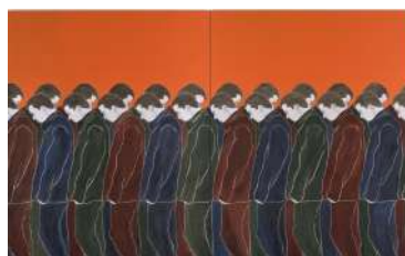
Djamel TATAH, Sans titre , 2016, huile et cire sur toile, diptyque, 250 x 400 cm, collection de l'artiste. © Jean-Louis Losi / © Adagp, Paris, 2022