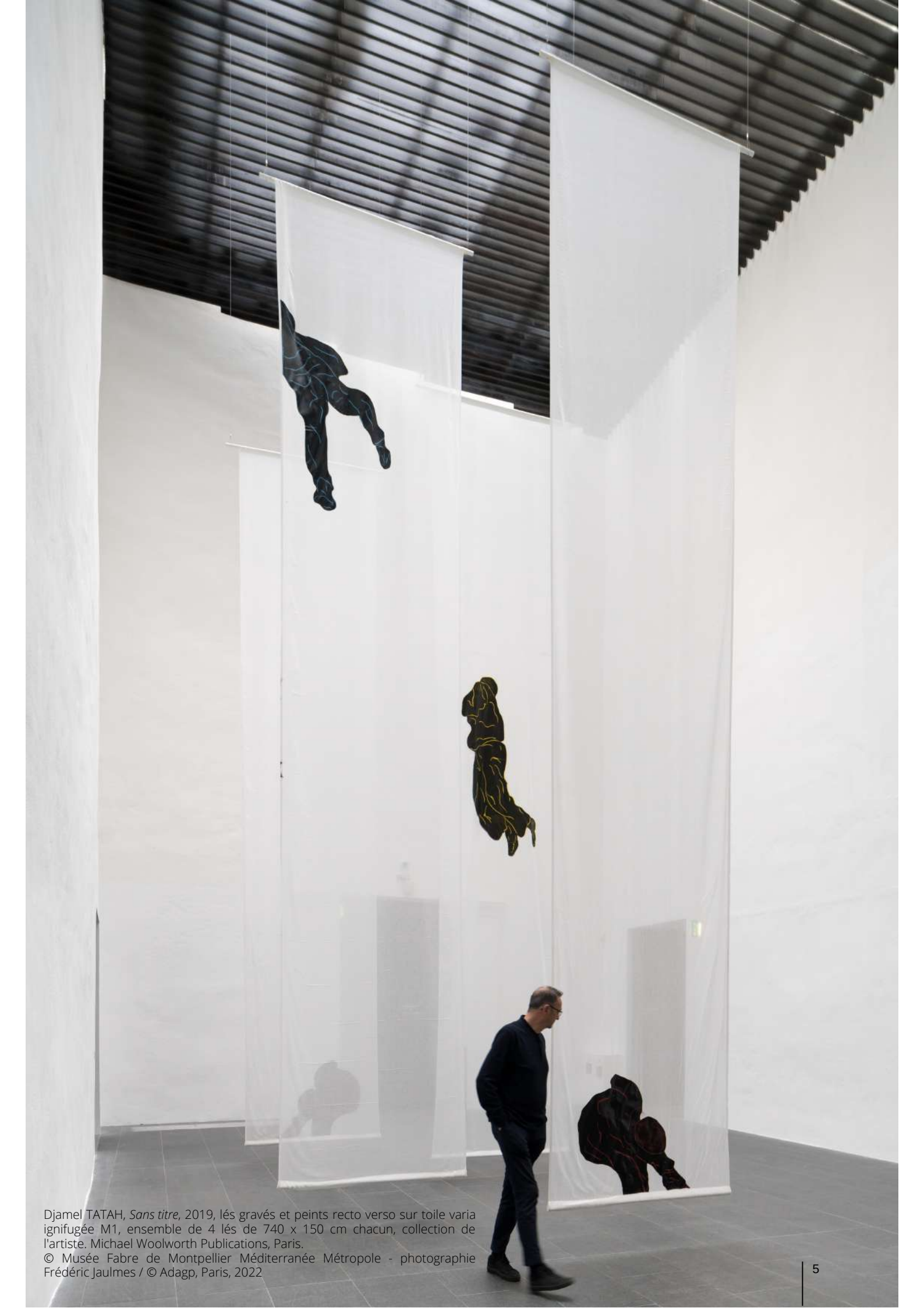
Djamel TATAH, Sans titre , 2019, lés gravés et peints recto verso sur toile varia ignifugée M1, ensemble de 4 lés de 740 x 150 cm chacun, collection de l'artiste. Michael Woolworth Publications, Paris. © Adagp, Paris, 2022