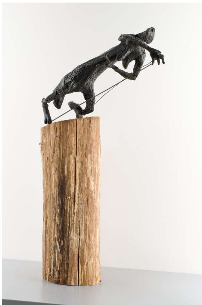
Germaine RICHIER, L'Araignée I , 1946, bronze patiné, socle en bois, 83x23x52, Montpellier, musée Fabre, 2006.12.1

Cette exposition de référence, conçue en partenariat avec le Centre Pompidou, entend offrir un nouveau regard sur l'œuvre d'une des sculptrices les plus importantes de son époque. Elle en dévoilera l'extraordinaire richesse, diversité et inventivité plastique, son lien intime avec la nature tout en soulignant ses résonances contemporaines, à l'heure d'une prise de conscience globale du vivant.