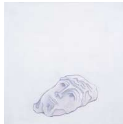
Djamel TATAH, Sans titre , 2016, huile et cire sur toile, 70 x 70 cm, collection de l'artiste. © Jean-Louis Losi / © Adagp, Paris, 2022