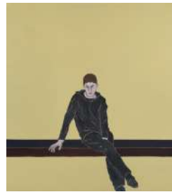
Djamel TATAH, Sans titre , 2016, huile et cire sur toile, 220 x 200 cm, Paris, galerie Poggi. © Jean-Louis Losi / © Adagp, Paris, 2022