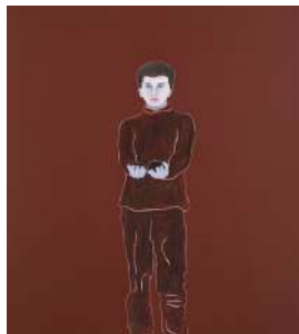
Djamel TATAH, Sans titre , 2016, huile et cire sur toile, 180 x 160 cm, collection de l'artiste. © Jean-Louis Losi / © Adagp, Paris, 2022