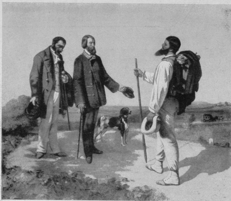
COURBET 1854: « Bonjour, Monsieur Courbet »

Grâce à l'obligeance des autorités de Montpellier, il sera possible d'exposer à Berne durant deux mois la remarquable collection de tableaux du Musée des Beaux-Arts de la célèbre cité universitaire française. Cette exposition vient d'obtenir un très vif succès à Paris.