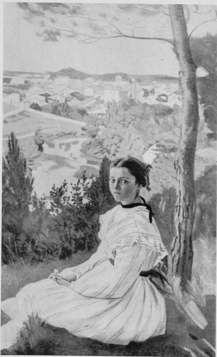
FRÉDÉRIC BAZILLE 1868: La vue du village.